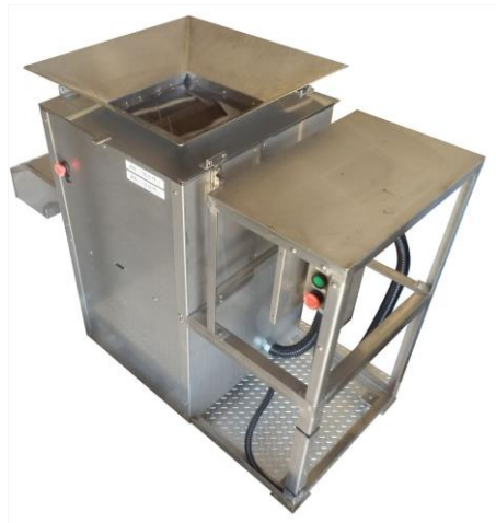
1. 玉葱を細かく破碎