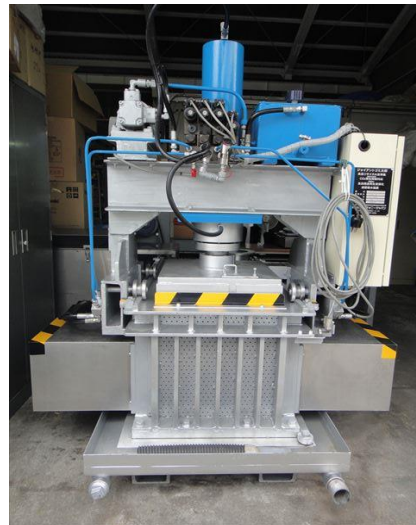
2. 僅かな電力でプレス